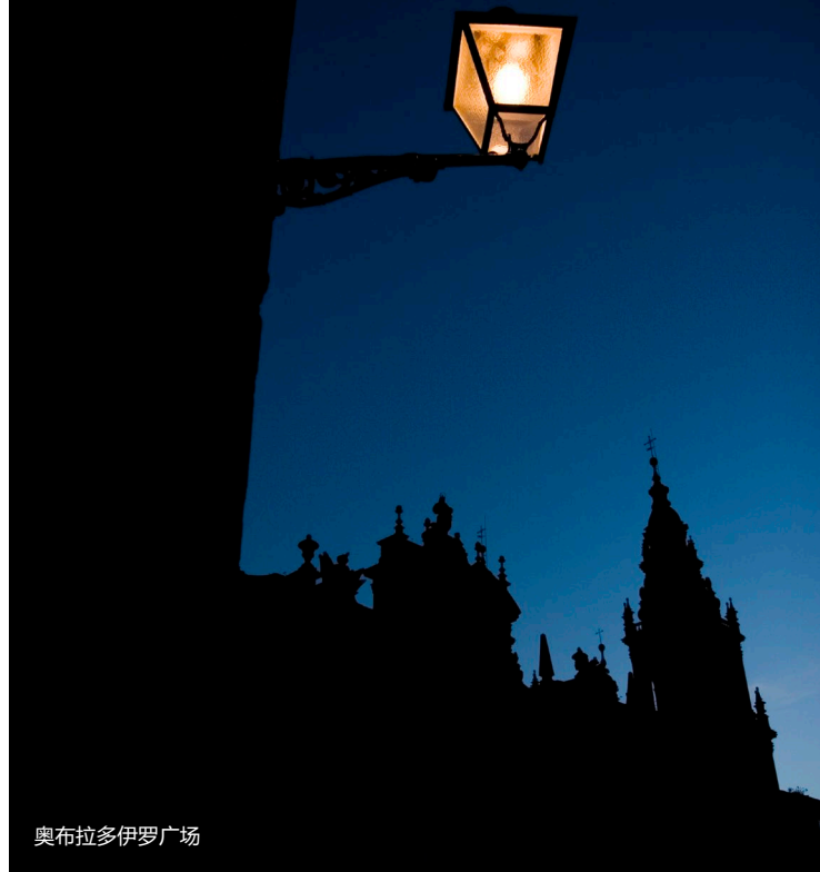
奥布拉多伊罗广场

请参观贝尔维斯修道院和威严的梅诺尔神学院，它们被一条天然护城河与名胜古迹区分割开。接下来，在贝尔维斯公园漫步。在高处，你将欣赏到城市的美景。