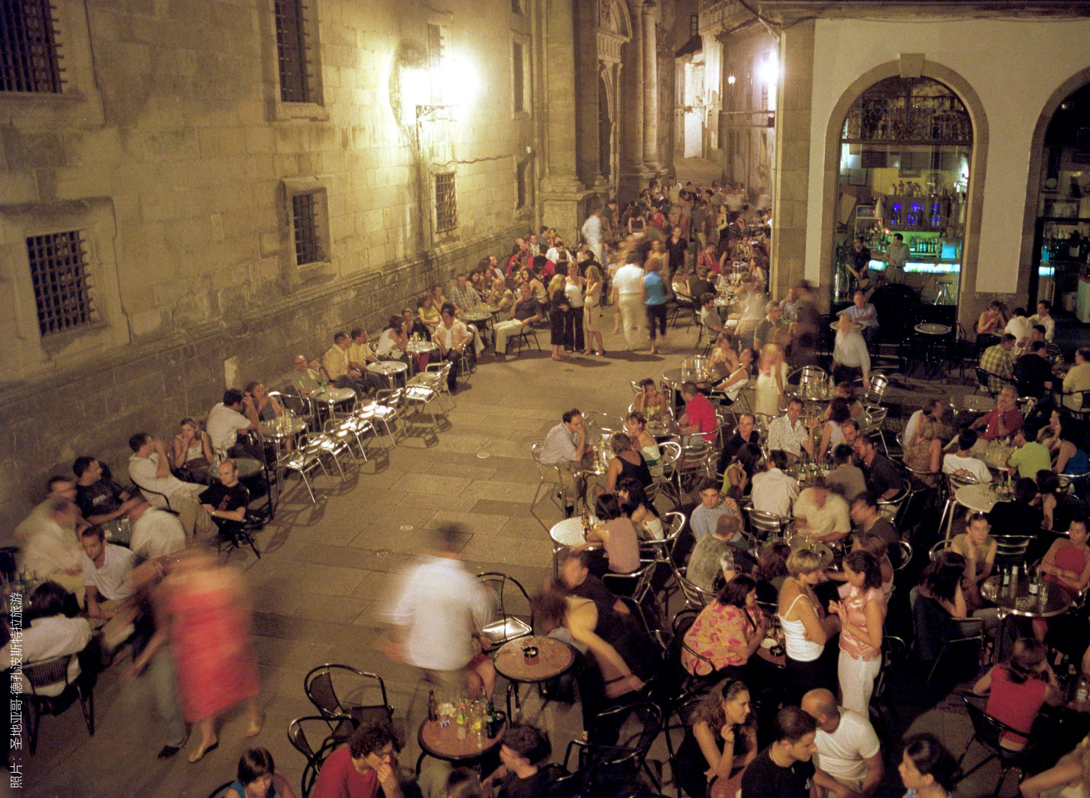
▲ SAN PAIO DE ANTEALTARES