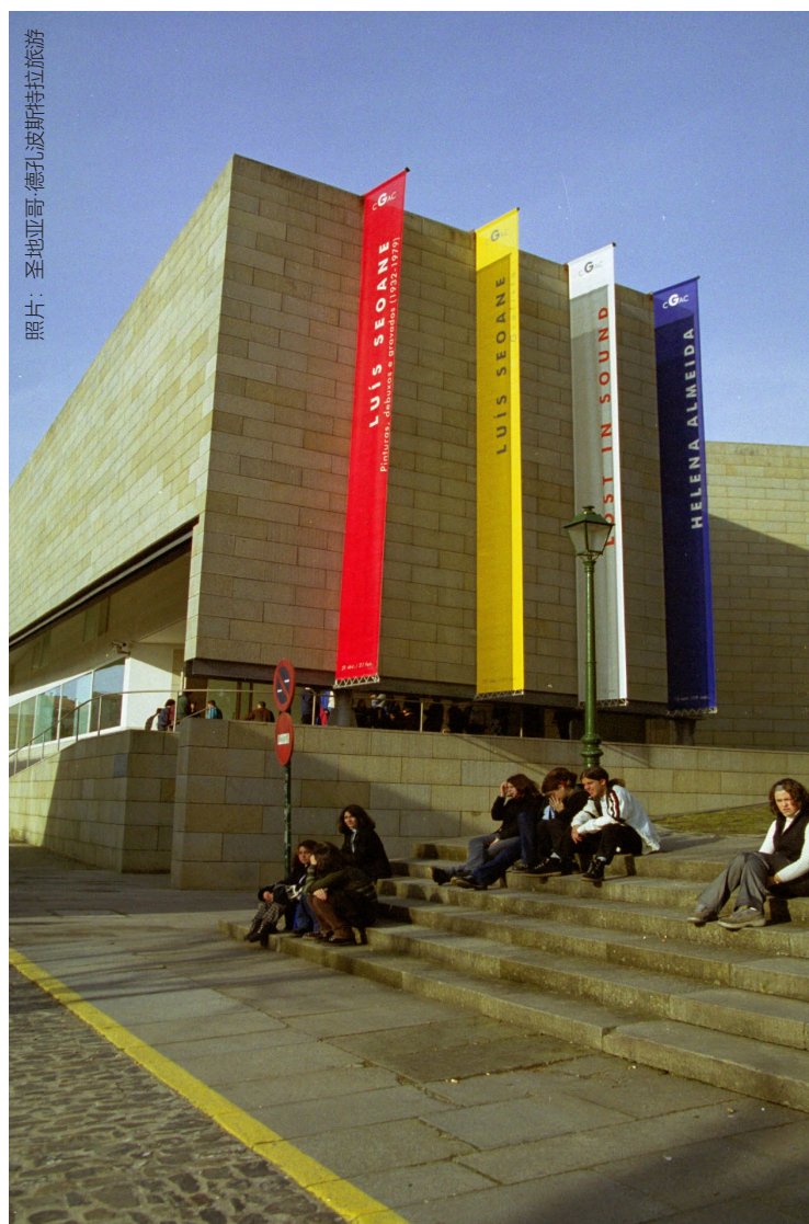
加利西亚当代艺术中心

在加利西亚当代艺术中心举行面向家庭的工作坊，孩子们在这里将体验艺术。他们还会喜欢像波博加莱戈或魔法博物馆这样的博物馆。