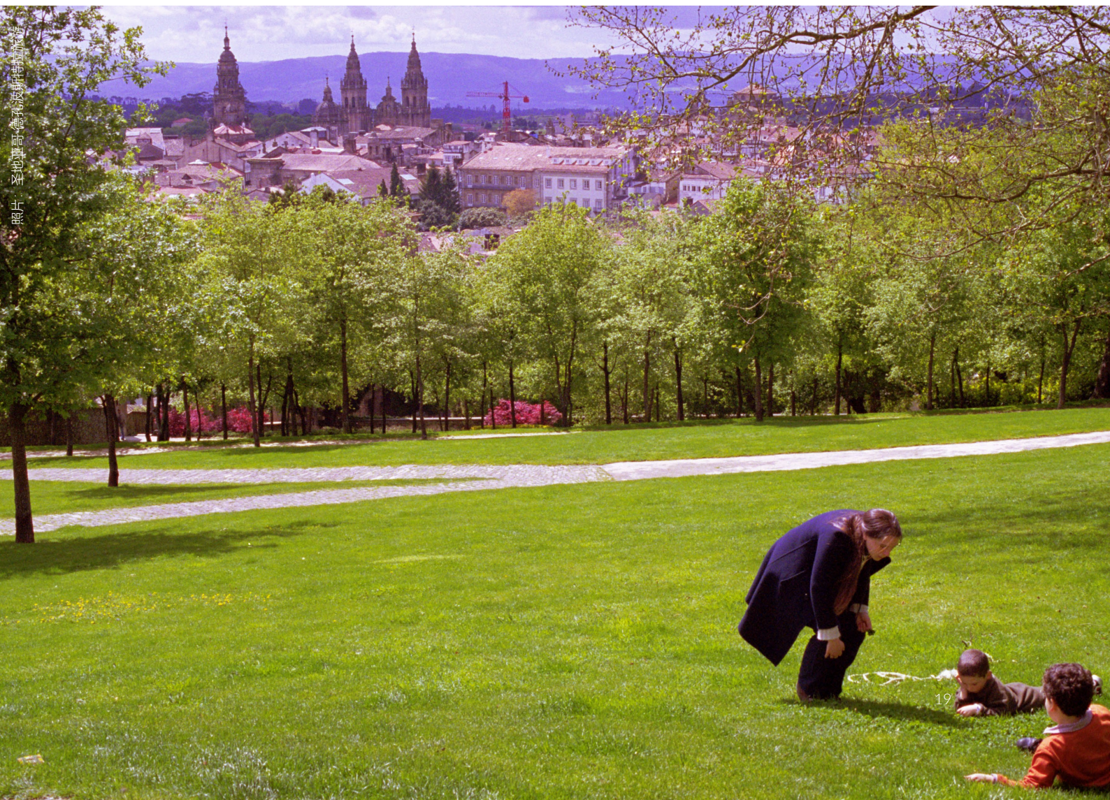
照片：圣地亚哥-德孔波斯特拉