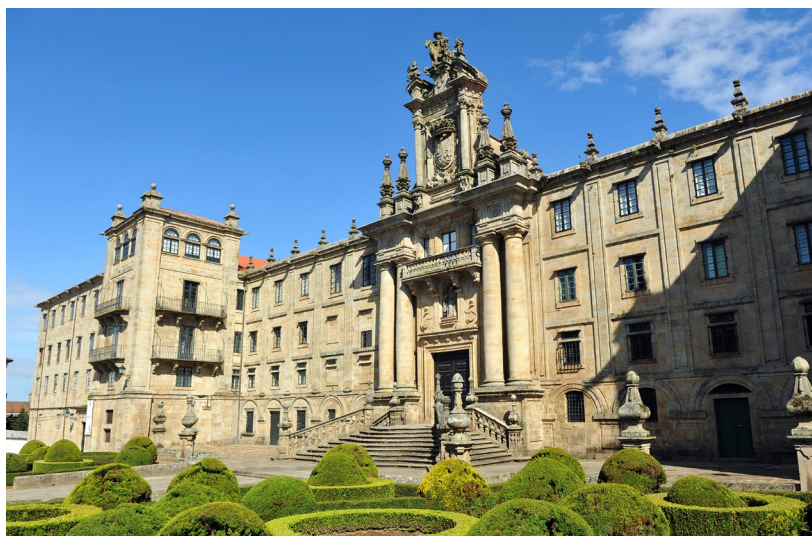
▲ 圣马丁皮纳利奥修道院

金塔纳广场是圣地亚哥老城区最具代表性的空间之一。这里有钟塔，从城中几乎每一个角落都可以看到它。迷失在它周围的街道上，在这里你总能找到一座巴洛克风格的房