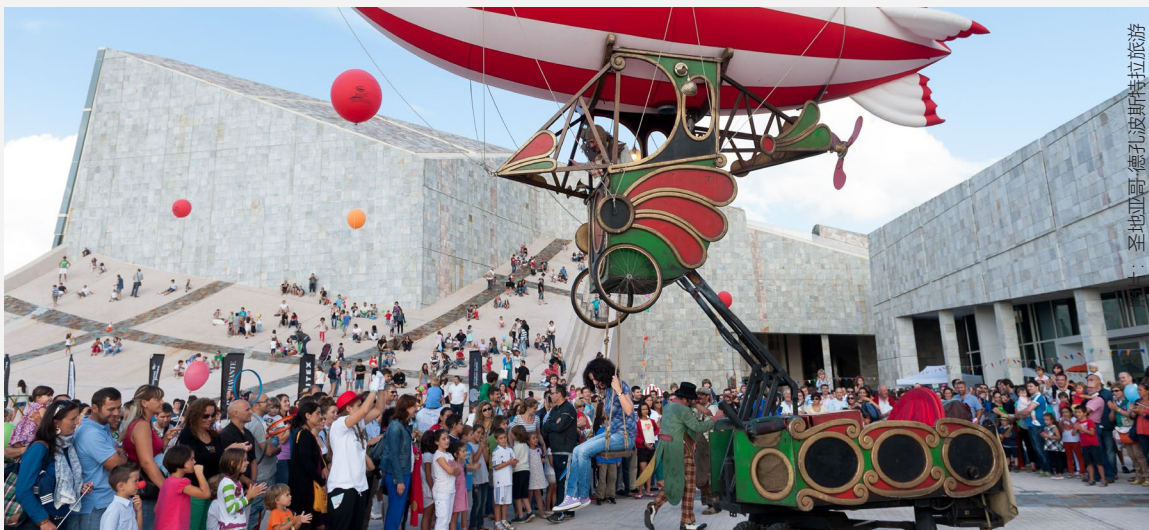
圣地亚哥·德孔波斯特拉旅游