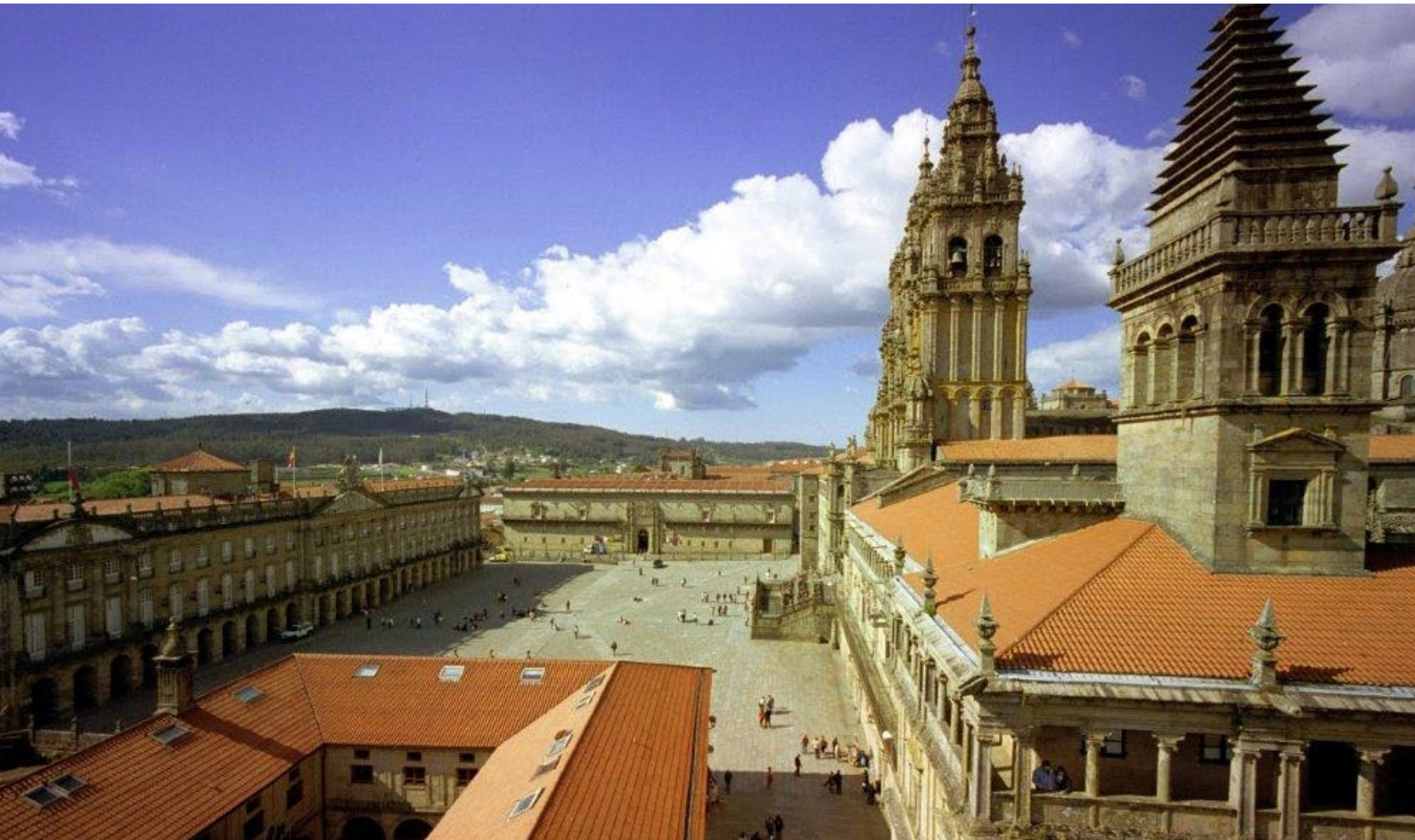
▲ 奥布拉多伊罗广场